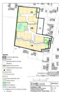
Figur 2: Udkast til fremtidig tæt lav udnyttelse af delområde 1A, 1B og 1C.

Ved åben lav boligbebyggelse skal grunde udstykkes med en størrelse på 700 til 1.000 m 2 .