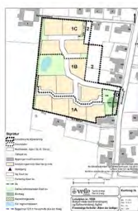
Figur 3: Udkast til fremtidig åben lav udnyttelse af delområde 1A, 1B og 1C.