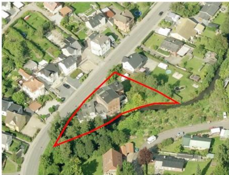
Figur 1: Luftfoto af lokalplanområdet og den oprindelige valsemølle.

Lokalplanen indeholder bestemmelser om materialer, murforbandter og vinduesformater. Lokalplanen skelner mellem den offentligt synlige facade mod Grejsdalsvej, hvor den skal fremstå som den oprindelige valsemølle. For at sikre bedst mulig boligkvalitet gives der mulighed for større vinduespartier og altaner på facaden imod Grejs Å.