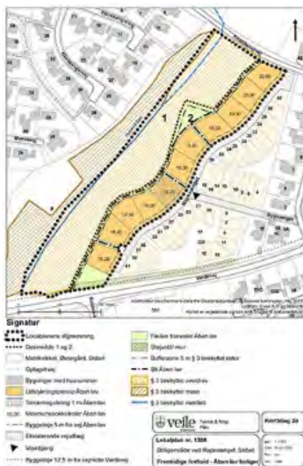
Figur 2 Forslag til fremtidig åben-lav udnyttelse af lokalplanområdet.