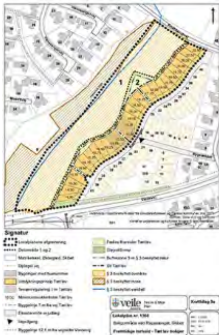
Figur 1 Forslag til fremtidig tæt-lav udnyttelse af lokalplanområdet.

Denne lokalplan udtager således delområde 1 (§ 3 beskyttede naturområder) og delområde 2 (udlagt til åben-lav boligbebyggelse) fra området for lokalplan nr. 1045.